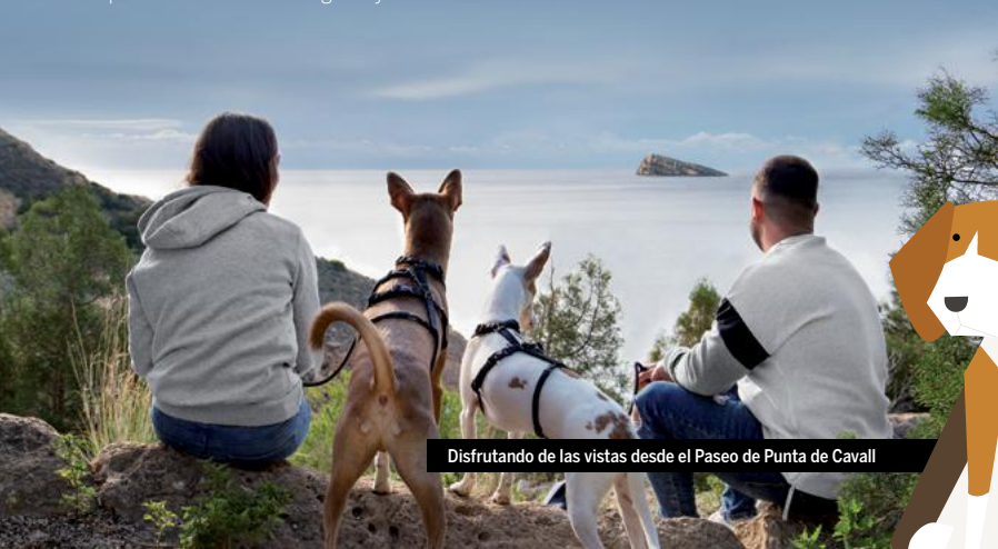
Disfrutando de las vistas desde el Paseo de Punta de Cavall

3 PASEOS, 3 EXPERIENCIAS ÚNICAS // Pasear olisqueando, luciendo manto y moviendo caderas... ¡la actividad preferida de nuestros perretes! Aquí te proponemos 3 paseos para no dejar de mover las patitas: