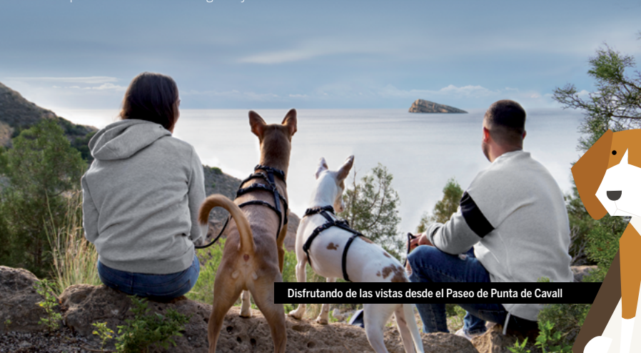
Disfrutando de las vistas desde el Paseo de Punta de Cavall

3 PASEOS, 3 EXPERIENCIAS ÚNICAS // Pasear olisqueando, luciendo manto y moviendo caderas... ¡la actividad preferida de nuestros perretes!. Aquí te proponemos 3 paseos para no dejar de mover las patitas: